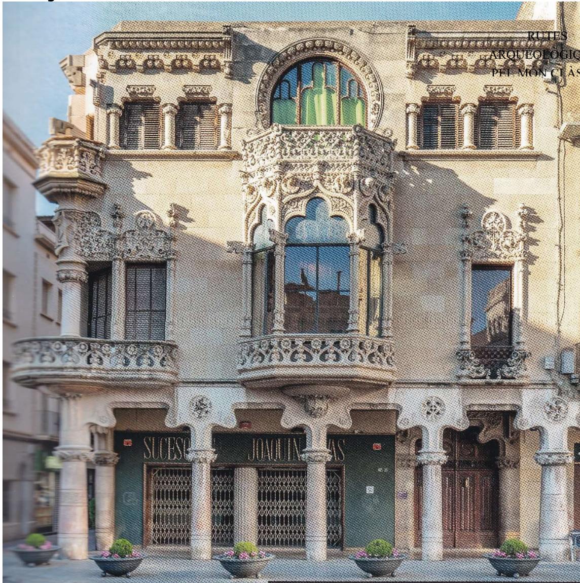
Façana de la Casa Navàs